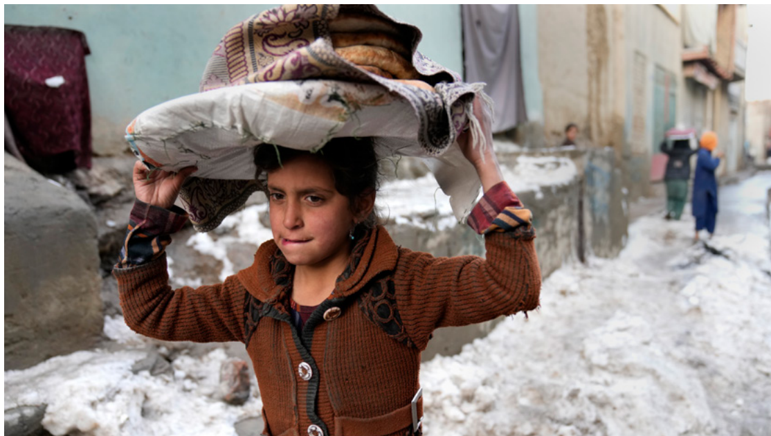
Die Versorgung mit Nahrung ist prekär, die Menschen in Afghanistan leiden an Hunger. Februar 2022

Bis heute verfügen lokale Taliban-Führer über erhebliche Autonomie, was dazu führt, dass in den verschiedenen Provinzen unter-