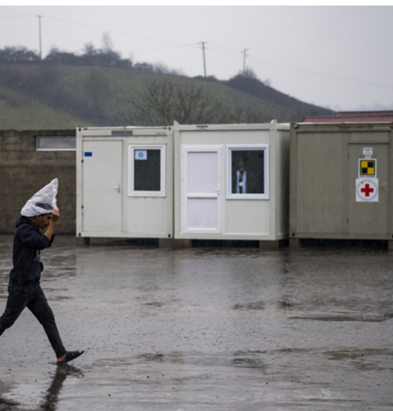
Keine Hilfe für psychisch Erkrankte. Foto: Flüchtlingslager Miral im Grenzgebiet Kroatiens (© KEYSTONE/Jean-Christophe Bott).

Die Situation geflüchteter Menschen in Kroatien ist in vielerlei Hinsicht problematisch. Was verschiedene Medien seit Monaten berichten, bestätigen auch der Europäische Gerichtshof für Menschenrechte (EGMR), der