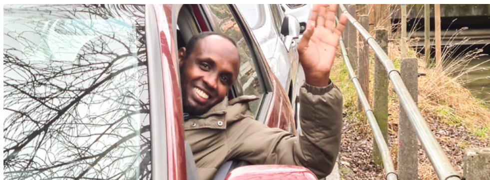
Der Führerschein öffnet vielen Geflüchteten mit F-Ausweis den Weg zu besser bezahlter Arbeit.

Die vorläufige Aufnahme wird auch an den Flüchtlingstagen am 18./19. Juni 2022 Thema sein. www.fluechtlingshilfe.ch/vorlaeufige-aufnahme